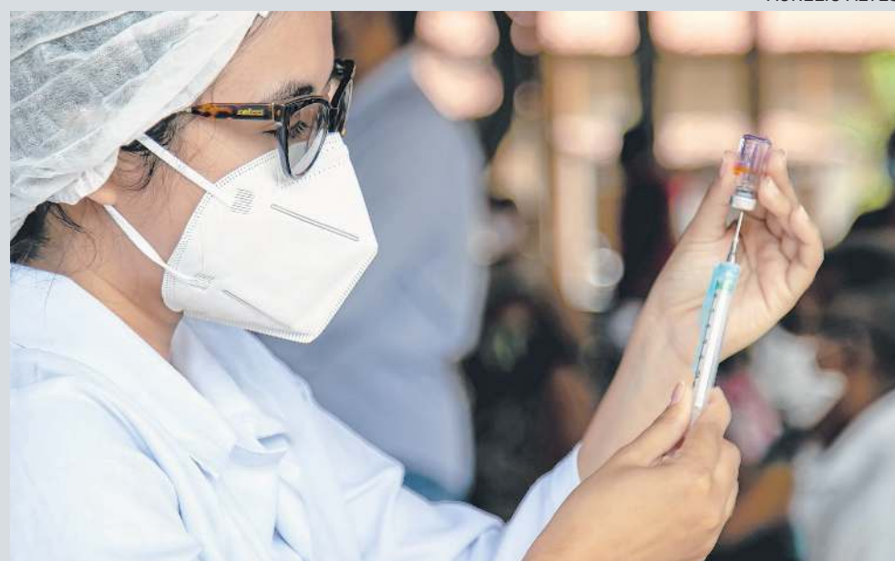
VACINAÇÃO contra a Covid-19 teve início em Fortaleza há uma semana

A partir da chegada dos próximos lotes de imunizantes, novos locais de vacinação serão gradativamente estabelecidos. Dentre eles, destacam-se os Cucas, o ginásio Paulo Sarasate e o estádio Presidente Vargas. "Estamos adequando a logística de acordo com a demanda dos grupos prioritários deste primeiro faseamento. Já vacinamos os idosos nas instituições de longa permanência e, a partir do recebimento de novas vacinas, anunciaremos novos calendários", afirmou o prefeito Sarto Nogueira em entrevista coletiva na manhã desta segunda-feira, 25.