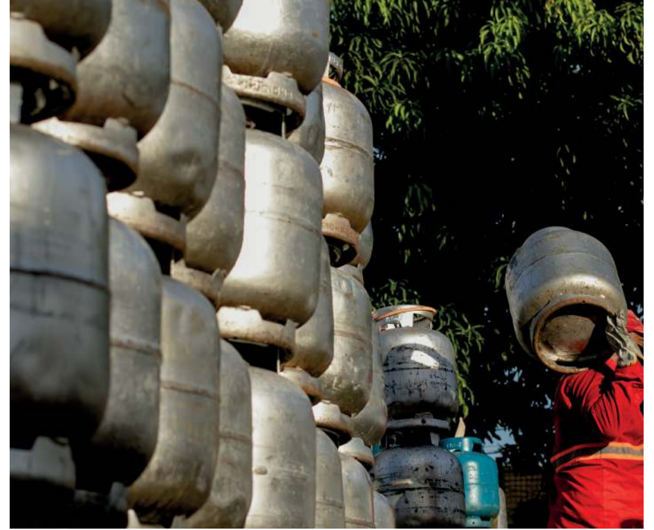
HÁ TRÊS SEMANAS, o preço do botijão de 13kg é encontrado até R$ 100 no Ceará